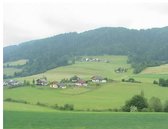
Abbildung 1: Landschaft ist Bild und Prozess

Form, Struktur, Nutzung und Pflege der Landschaft bestimmen ihre Fähigkeit Wasser zu speichern und zu filtern. Die Landschaft beeinflusst die Wasserqualität. Die Nutzung und Pflege innerhalb der einzelnen Elemente der Landschaft bestimmt, in wieweit die Landschaft ihre Funktion als Wasserfilter und Wasserspeicher steigern kann. Ein gut gepflegter Wald speichert mehr Wasser als ein wenig gepflegter Wald. Siedlungsbauten mit Versickerungsflächen und Regenwassernutzung verzögern den Abfluss von Wasser. Lange Verweilzeiten von Wasser in der Landschaft sind günstig, denn sie verringern zusätzlich die Wahrscheinlichkeit der Extremereignisse Flut und Dürre. Wasser selbst ist ein Wirtschaftsfaktor der Landschaft. Landwirtschaft, Tourismus, Industrie und Energiewirtschaft sind Wirtschaftsbereiche, die auf der Verfügbarkeit von Wasser in der Landschaft beruhen. Die Bewertung und Kosten von Wasserressourcen sind in den letzten Jahren zu einem wichtigem Thema geworden.