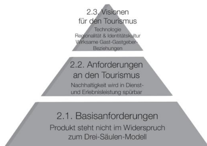
Abb. 2 Nachhaltigkeitspyramide im Tourismus

Besonders im Tourismus steht die Nachhaltigkeit vor einer schwierigen Aufgabe. Einige Felder werden im Folgenden näher erörtert und weiters wird auch konkret auf Österreich als Tourismusland eingegangen.