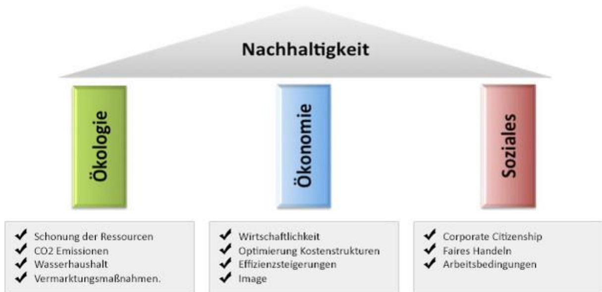
Abb. 1 3-Säulen-Modell der Nachhaltigkeit